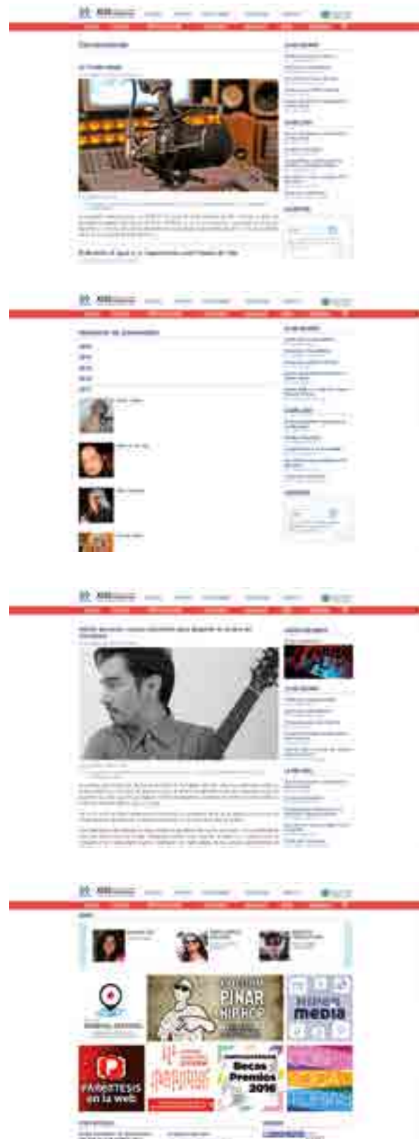
Foto-galerías, dossier de diversos temas, selfies —los propios artistas anuncian sus más recientes proyectos—, convocatorias, paréntesis en la web, memorias (mejores películas para descargar), tabloide de Becas y Premios de la AHS, proyectos de colaboración internacional y un canal en youtube, son algunos de los accesos que incluyen los contenidos del sitio.

Sitio web www.ahs.cu (Premio Palma Digital) Portal informativo y cultural que promueve a los jóvenes creadores de la AHS. Cuenta con una amplia red de colaboradores en todo el país, quienes a través de diversas secciones debaten sobre el quehacer artístico de vanguardia.